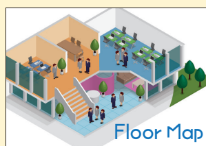
校舎内・店舗マップ